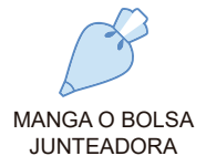
MANGA O BOLSA JUNTEADORA