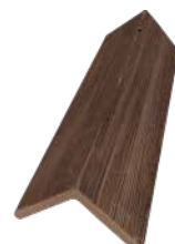
Remate lateral 90