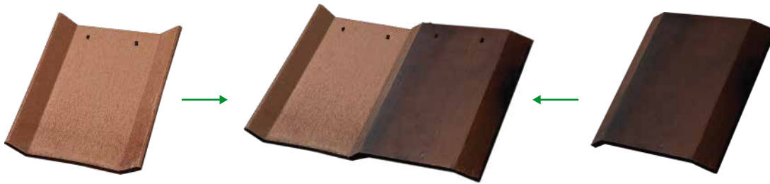
Charola (Teja Nuevo Vallarta Hembra)