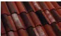
Red Wine Antique