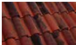
Red Wine Antique Dark