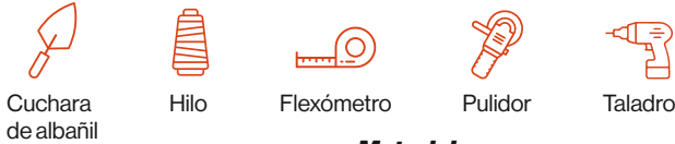
Cuchara de albañil